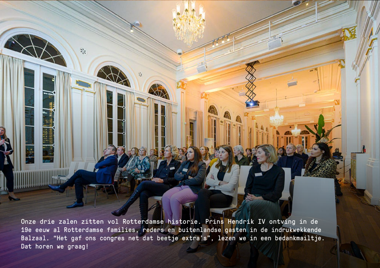
Onze drie zalen zitten vol Rotterdamse historie. Prins Hendrik IV ontving in de 19e eeuw al Rotterdamse families, reders en buitenlandse gasten in de indrukwekkende Balzaal. "Het gaf ons congres net dat beetje extra's", lezen we in een bedankmailtje. Dat horen we graag!