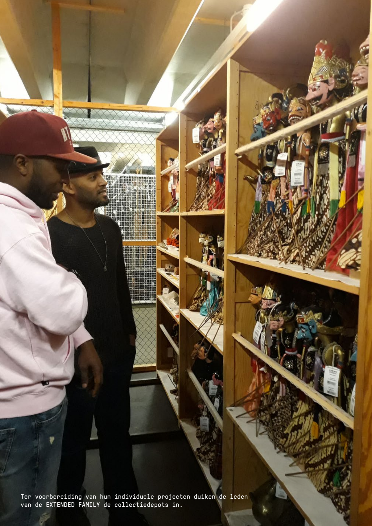
Ter voorbereiding van hun individuele projecten duiken de leden van de EXTENDED FAMILY de collectiedepots in.